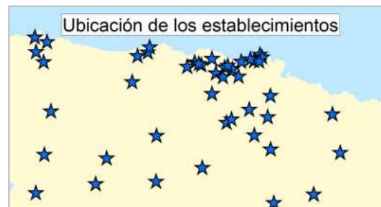
Ejemplos cartografía descriptiva